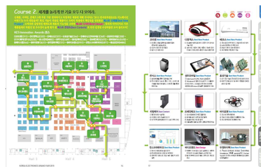
④ VIP투어코스 반영 및 가이드맵 수록