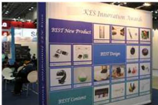
③ KES Innovation Awards Zone 운영