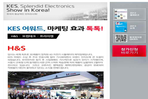
⑤ 어워드 수상작 소개 웹진 배포